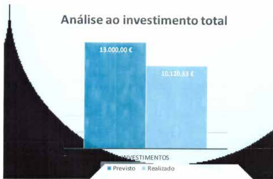
Gráfico 9 - Comparação dos Investimentos Previstos face aos Realizados na totalidade dos investimentos

[Handwritten signature] [Handwritten initials] [Handwritten initials]