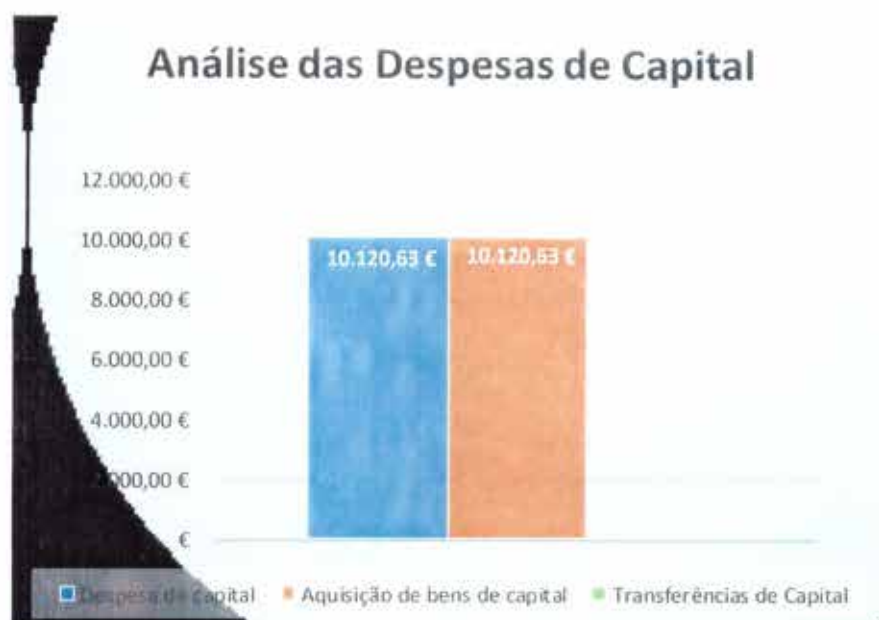
Gráfico 2 - Análise às Despesas de Capital

Analisando o gráfico seguinte, o agrupamento "07 – Aquisição de bens de capital" apresenta-se com um peso de 100,00% das despesas de capital realizadas.