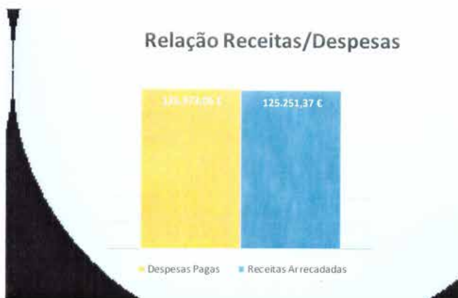
Gráfico 7 - Relação das Receitas Cobradas e das Despesas Pagas

[Handwritten signatures and initials in blue ink]