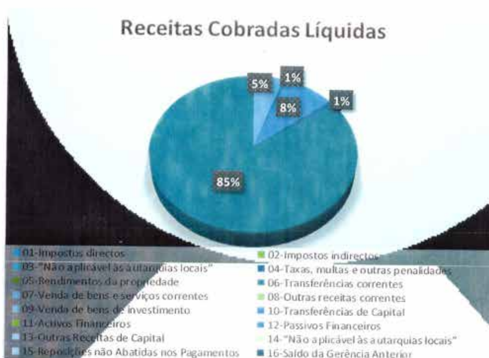
Gráfico 6 - Receitas Cobradas Líquidas

No que diz respeito às receitas de capital verifica-se que a autarquia previu arrecadar 795,00 €, tendo sido arrecadados 795,00 €, que se traduz num grau de execução orçamental das receitas de capital de 100,00%.