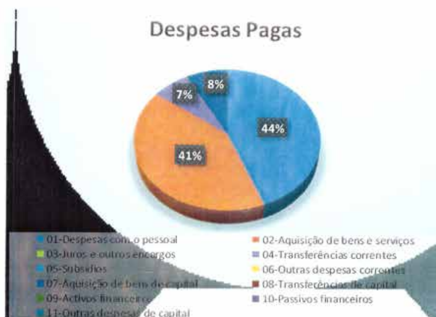
Gráfico 3 - Análise às Despesas Pagas

No gráfico seguinte é possível analisar a distribuição da despesa pelos diferentes agrupamentos da respetiva classificação económica, onde mais uma vez é possível facilmente constatar que o agrupamento em que a autarquia teve mais despesa foi o "01-Despesas com o pessoal".