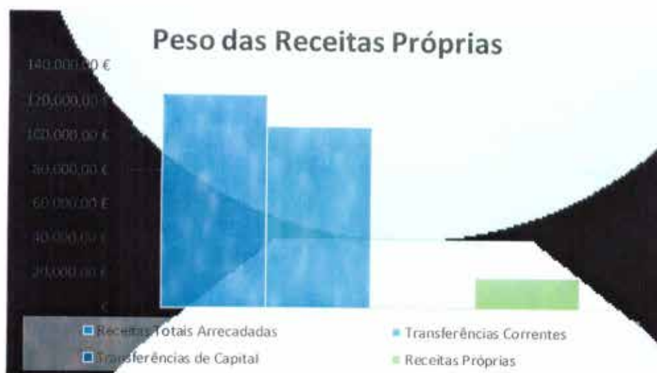
Gráfico 5 - Análise das receitas próprias

A Freguesia de Relva previu arrecadar um montante de 135.847,13 € dos quais arrecadou, 125.251,37 € que se distribuem principalmente pelos capítulos acima mencionados. O grau de execução orçamental das receitas situa-se nos 92,20%.