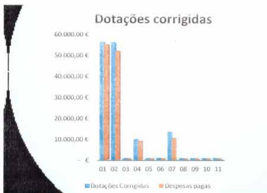
Gráfico 4 - Análise às Dotações Corrigidas face às Despesas Pagas

Através do gráfico 4 verifica-se mais uma vez que o agrupamento "01-Despesas com o pessoal" é aquele em que foram despendidos os maiores montantes.